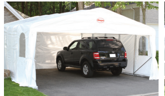
ABRI DOUBLE POINTU