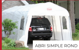
ABRI SIMPLE ROND