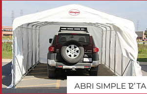
ABRI SIMPLE 12' TA