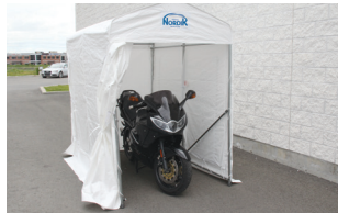
ABRI DE RANGEMENT

Un classique depuis plus de 40 ans. Un abri plus spacieux et très robuste!