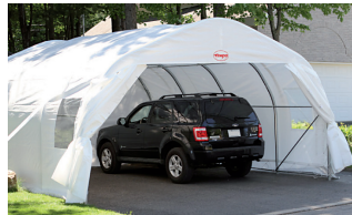
ABRI DOUBLE ROND