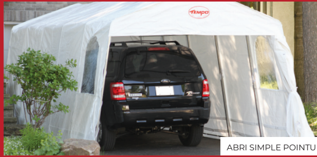
ABRI SIMPLE POINTU