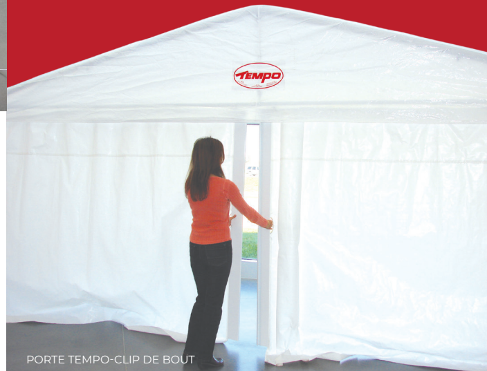
PORTE TEMPO-CLIP DE BOUT

Vous avez endommagé une pièce de votre abri TEMPO ? Nous l'avons en stock !