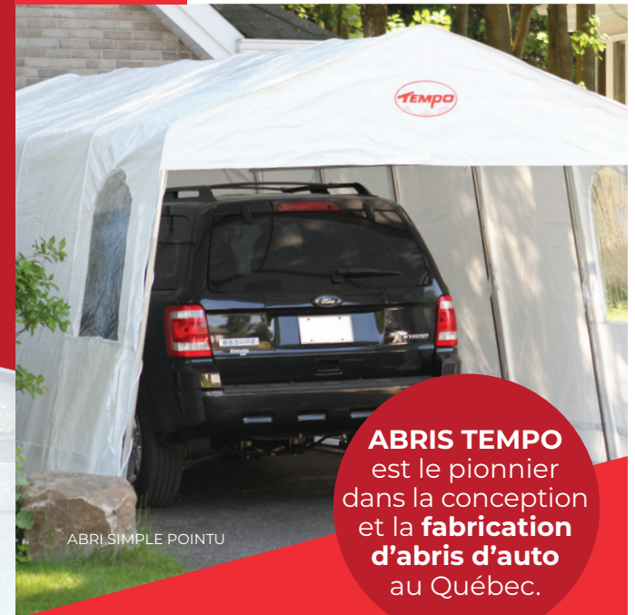
ABRI SIMPLE POINTU

ABRIS TEMPO est le pionnier dans la conception et la fabrication d'abris d'auto au Québec.